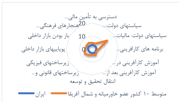
نمودار ۴. مقایسه اکوسیستم کارآفرینی در ایران با کشورهای منطقه MENA

نمودار ۴، مقایسه اکوسیستم کارآفرینانه ایران با کشورهای منطقه خاورمیانه و شمال آفریقا ۵۸ (MENA) نشان داده است که شاخص‌های اکوسیستم کارآفرینانه در ایران قریب به اتفاق کمتر از متوسط شاخص‌های اکوسیستم کارآفرینی در ۱۰ کشور عضو MENA شرکت‌کننده در گزارش GEM سال ۲۰۱۹ است.